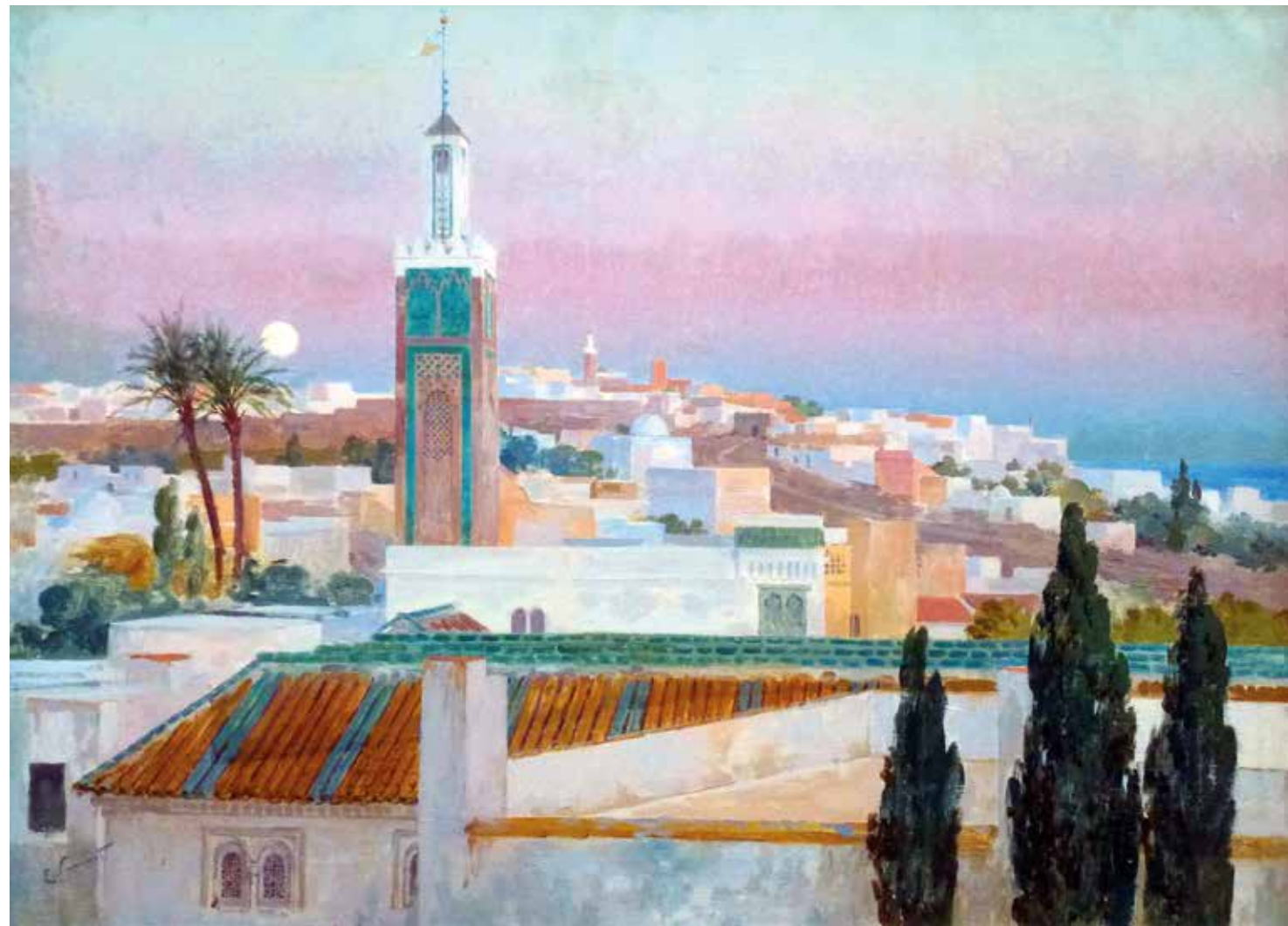
Atardecer en Tánger.