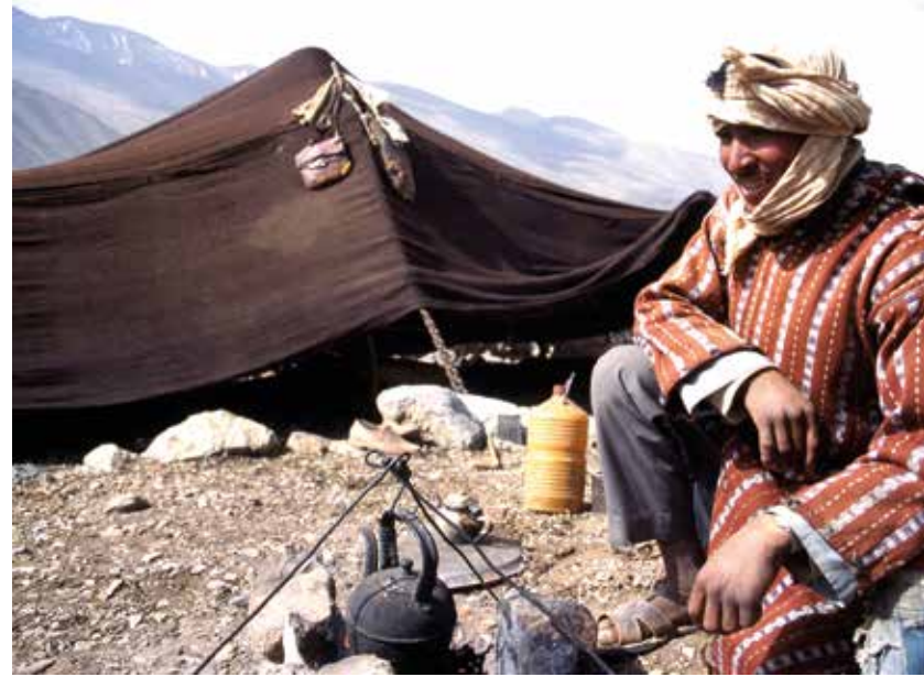
Un té en el camino con un nómada Ait Atá.

como elementos propios del paraíso. Un mundo de armonía en el que me sentía un verdadero Livingstone.