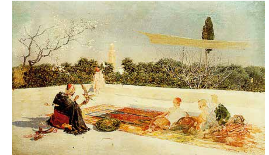
El maestro halconero en Marrakech.

Escorpión o Ramsés III, nombran a estas tribus en sus jeroglíficos e incluso lanzan algunas campañas militares para conquistar el oeste africano del Mediterráneo, con el objetivo de defenderse de estos pueblos. Un viejo texto egipcio describe a los bereberes como un pueblo de fieros guerreros, vestidos de abigarrados colores y con peculiares peinados trenzados sobre sus cabezas. Se sabe que estos pueblos cumplían culto al sol, influencia claramente egipcia, en la que las fechas de solsticio y equinoccio tenían una especial relevancia, así como aspectos muy extendidos en las religiones animistas, como son el matriarcado y la creencia en espíritus que habitaban en ciertos enclaves naturales.