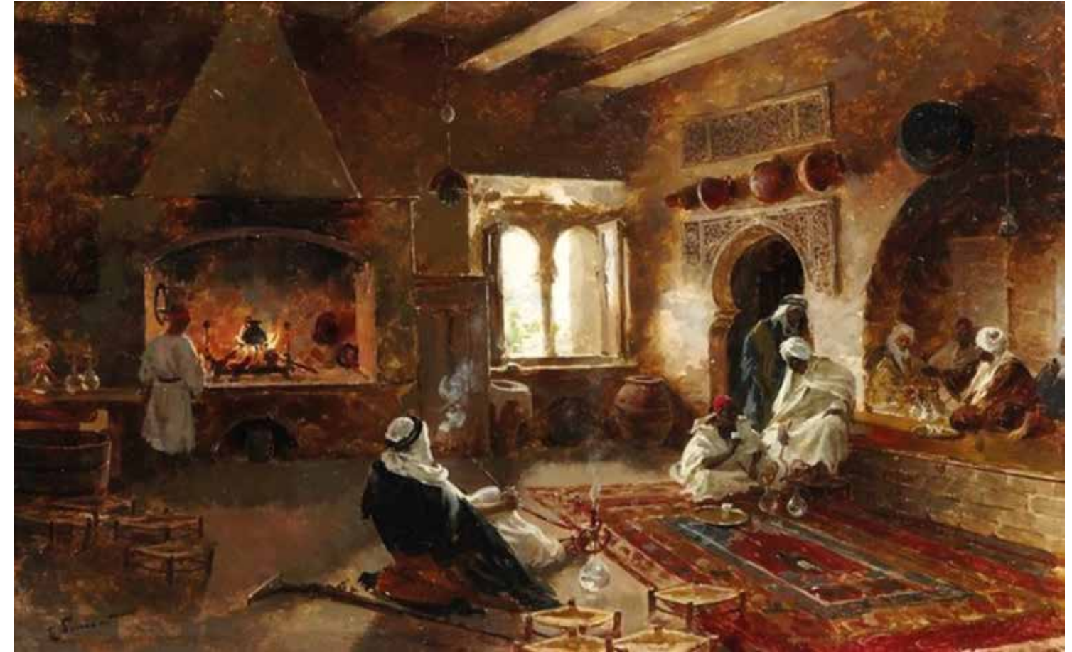
Fumando shisha en la tetería.

Descubrí que Marruecos no es todo desierto ni llano, sino un país de geografía intrincada, montañosa y muy variada. Que la