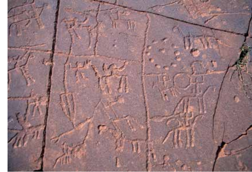
Grabado rupestre en el collado de Tizi n'Tirguist.

El desierto del Sahara se origina por el desplazamiento crónico hacia el norte de las borrascas atlánticas, dejando sin precipitaciones a estas regiones. En un periodo muy breve de tiempo, lo que durante miles de años era tierra fértil, se convierte en un crudo desierto. Esto obliga a toda forma de vida a migrar hacia el Norte buscando las lluvias que vierten sus aguas sobre las montañas del Atlas, la presión sobre los pastos de montaña aumenta originando las guerras neolíticas por el control sobre los pastos del Atlas y el Anti Atlas como podemos observar en la gran batalla del collado de Tizi n'Tir-