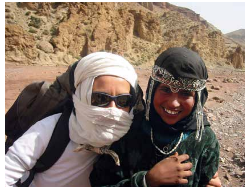
Con una joven de los Aït Mgoun.

Las tribus más romanizadas abrazan la religión cristiana mientras que las tribus de la montaña conservan sus creencias tradicionales. Florece la comunidad judía en los centros urbanos asociada a la actividad del comercio. En el declive del imperio romano, la influencia sobre la provincia de Mauritania Tingi-