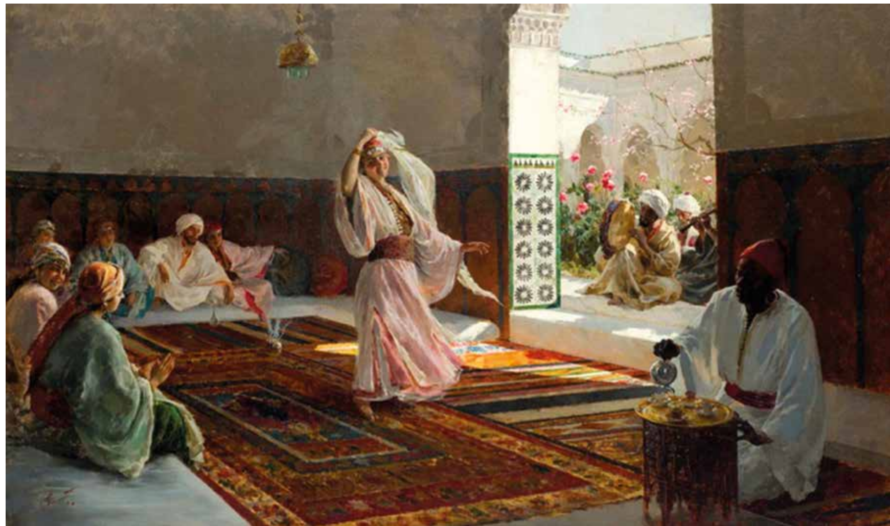
Danzarinas en Marrakech.