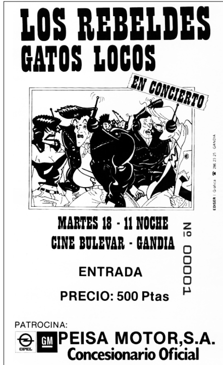
Entrada concierto de Los Rebeldes-Gatos Locos en Gandía